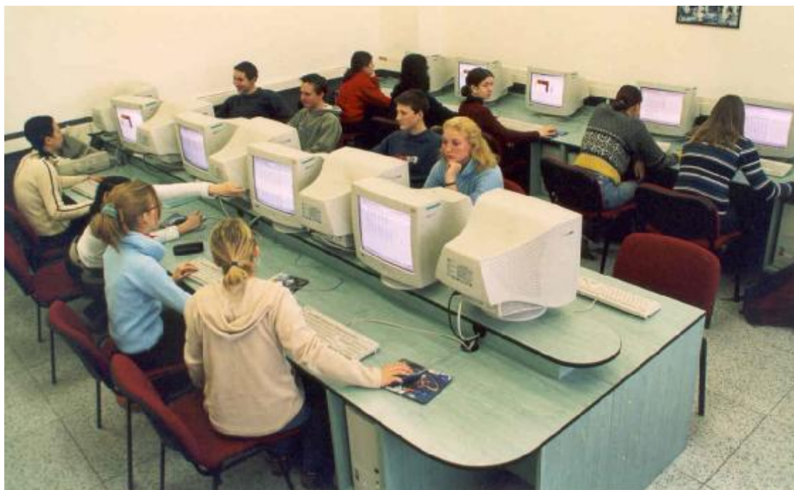
Zrekonstruovaná a modernizovaná učebna výpočetní techniky č. 88

I přes omezené finanční prostředky se částečně podařilo modernizovat školu v oblasti výpočetní techniky. Z prostředků investičního fondu byla provedena rekonstrukce a modernizace jedné počítačové učebny. Úroveň vybavení učeben je však velmi různorodá. v současné době jsou ve škole čtyři počítačové učebny, tři učebny fiktivních firem a jedna učebna obchodní korespondence. Počítačová technika je však v řadě případů zastaralá. v každé učebně VYT je k dispozici minimálně jedna tiskárna, při výuce bychom chtěli více používat dataprojektor, který jsme zakoupili ze schváleného příspěvku zřizovatele Středočeského kraje. Při plném obsazení školy (OA i VOŠE) bude nutno zřídit další učebnu výpočetní techniky, aby výuka mohla probíhat podle schválených osnov a v souladu se standardy. Nebereme přitom v úvahu současný jasný trend používání výpočetní techniky napříč všemi vyučovanými předměty, což by znamenalo instalaci 3 - 5 PC do všech učeben.