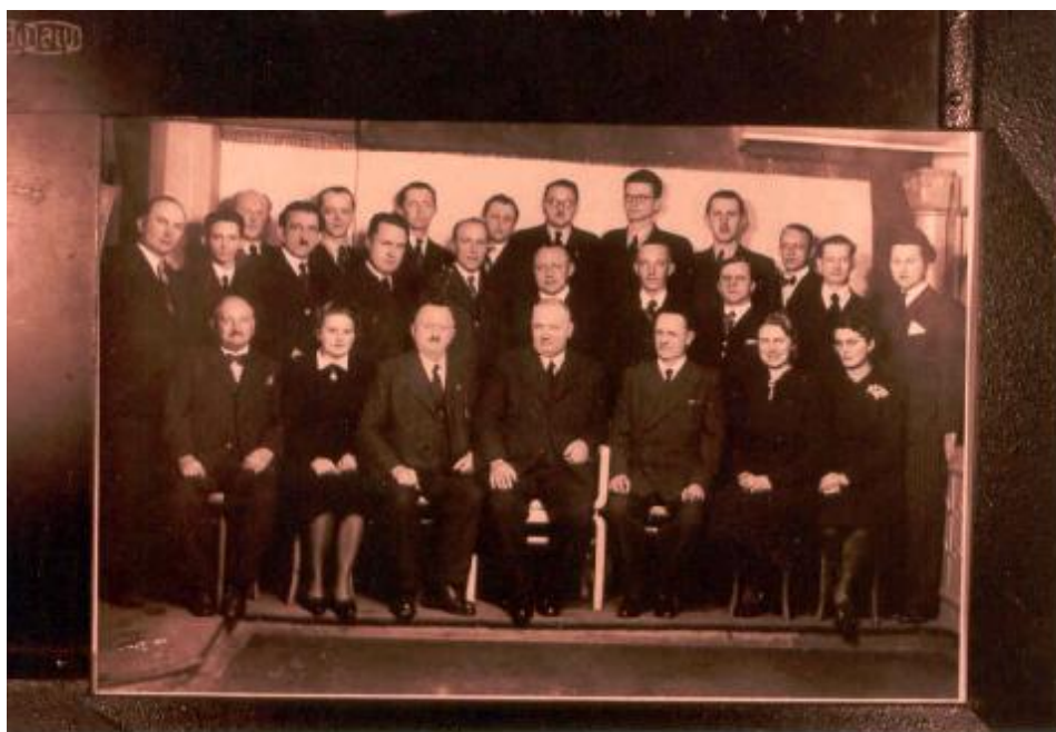
Fotografie profesorského sboru ze dne 26. března 1941

znam v regionálním školství. v hledání optimální realizace a v dílčích korekcích se ustálila doba školy jako instituce, která při uplatnění vysokoškolských postupů připravuje odborníky pro vykonávání náročných funkcí ve vyučovaných oborech. Nelehká práce týmu vyučujících byla v červnu 1999 završena prvními závěrečnými zkouškami – absolutoriem, jímž opustilo školu čtyřicet mladých lidí s titulem diplomovaný specialista v oboru. Od školního roku 1999/2000 si uchazeči o studium mohou vybrat i nový obor, automatizované informační systémy v řízení (AISŘ), školní rok 2000/2001 pak pro veřejnost přinesl novou vzdělávací možnost: otevření dálkového studia v oboru finanční řízení.