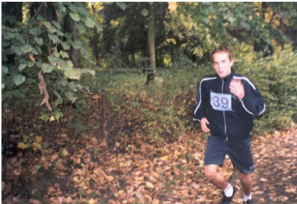
Přespolní běh 2002 – R. Edr 1. B