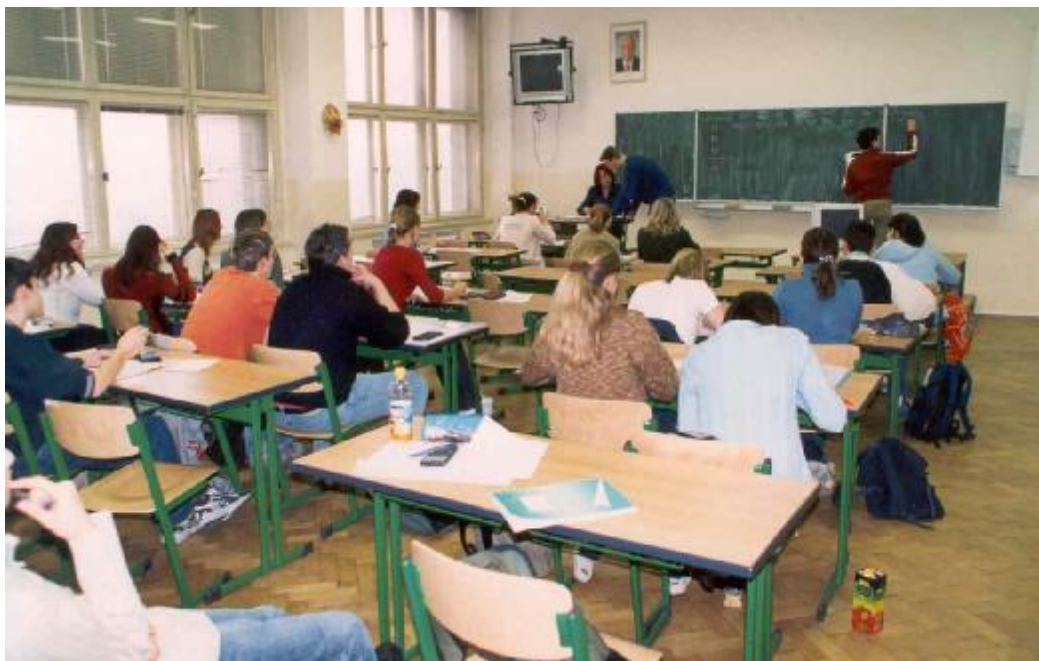
Upravená učebna č. 27

Z důvodů zajištění bezpečnosti bylo ve škole instalováno monitorovací a záznamové zařízení. Po jeho spuštění téměř vymizely krádeže v prostorách školy.