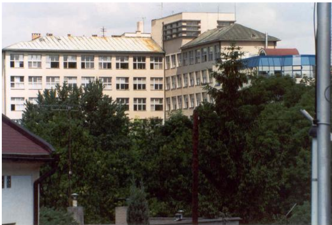
Budova školy v roce 2003

Budova školy i s přílehlými pozemky je majetkem města Mladá Boleslav. S městem máme uzavřenu nájemní smlouvu na dobu neurčitou, počínaje dnem 1. ledna 1994. Podle této smlouvy jsme povinni hradit nájemné, které se nám v tomto roce podařilo díky novému zřizovateli, Středočeskému kraji, plně vyrovnat i zaplatit veškeré dluhy z minulých let. S účinností od 1. ledna 2002 byla výše nájemného opět upravena na jeho téměř původní výši.