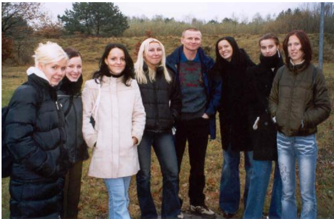
Návštěva čističky odpadních vod v Hannoveru v rámci projektového setkání našich studentů se studenty z Gifhornu na společné cestě do Holandska